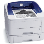
Phaser 3250 illustrée avec le Magasin 2 en option