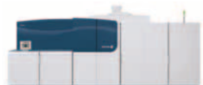
Stabilité de production sans précédent