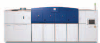
Impression couleur grande vitesse et longévité d'un système de production de masse