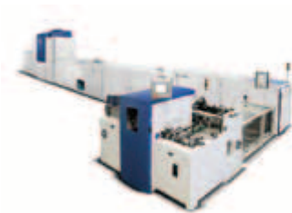
La seule solution numérique en ligne intégrée dédiée à l'emballage