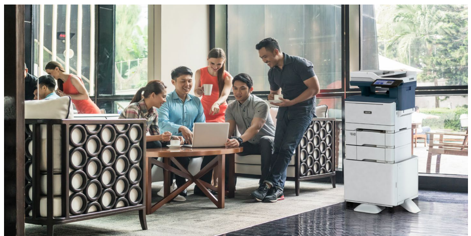
Imprimante couleur multifonction Xerox® VersaLink® C415

Véritable révolution dans le secteur de l'impression, Workplace Kiosk peut être installée dans pratiquement n'importe quel environnement. Les clients scannent simplement un code QR sur l'imprimante pour transformer leur appareil mobile en imprimante multifonction à distance. Une expérience intuitive, sans contact, sans tracas.