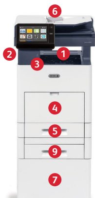
Imprimante multifonctions Xerox® VersaLink® B605 Impression. Copie. Numérisation. Télécopie. Courrier électronique.