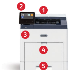
Imprimante Xerox® VersaLink® B600 Impression.