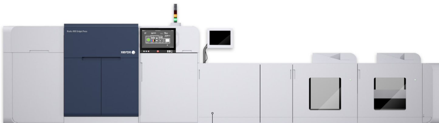
Module de perforation dynamique